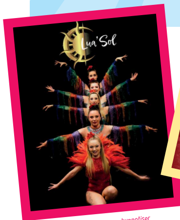
Lua Sol : laissez-vous hypnotiser par les rythmes effrénés